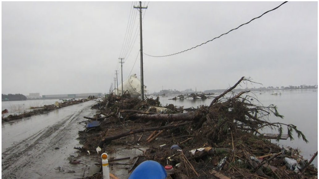
宮城県名取市にて 2011/3/15